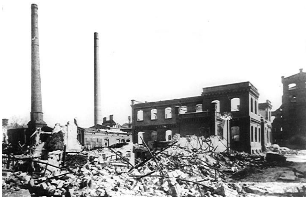
Tuchfabrik Sommerfeld in der Lobedanstraße