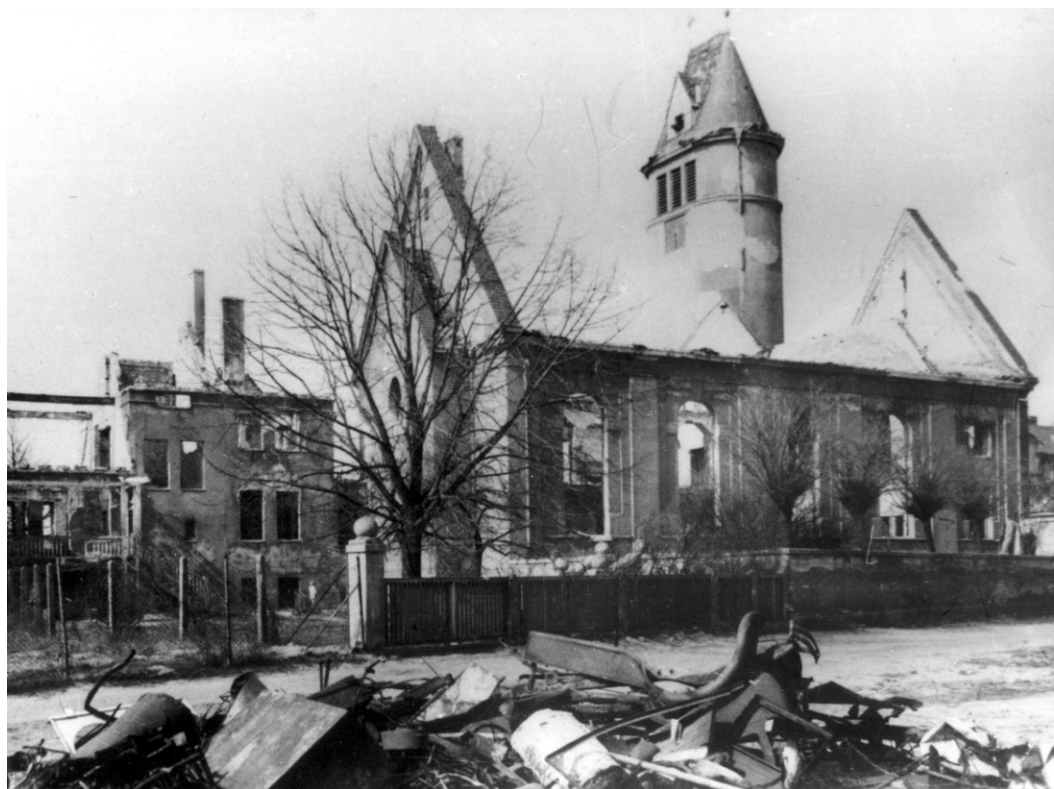
Blick auf die Lutherkirche Cottbus

gez. Reinhard Droglä Vorsitzender der Stadtverordnetenversammlung Cottbus